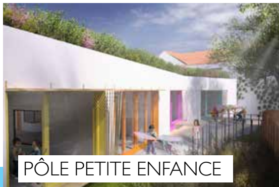
PÔLE PETITE ENFANCE

L'hébergement en appartement relais individuel garanti l'intimité des familles et personnes accueillies. Il permet aussi de mettre en place un accompagnement social individuel et global efficace permettant de trouver une solution adaptée à la sortie de l'urgence sociale.